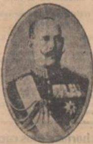
EL REY CONSTANTINO DE GRECIA

Londres, 9.—En vista de la gravedad de la situación de Anatólia, no se cree posible que se reuna la conferencia de Venecia para tratar de los asuntos del cercano Oriente.