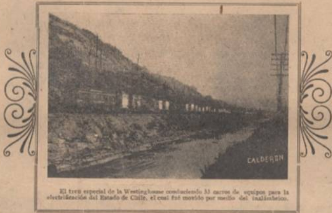
El tren especial de la Westinghouse conduciendo 33 carros de equipos para la electrificación del Estado de Chile, el cual fue movido por medio del inalámbrico.

Los transformadores y equipos de switches son de los últimos modelos de la Westinghouse, los cuales modelos han prestado excelentes servicios en