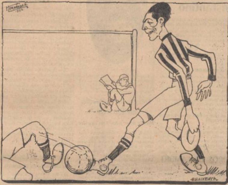
La muralla de la Gimnástica — El Gran Taca

quedaría empatada. La Directiva, consecuente con su deseo de justicia, pidió al juez ampliara su informe, cosa que aquel hizo. Según esa ampliación, el tanto es perfectamente válido y lo contempla la regla 6 al decir que para considerarse al jugador está fuera de juego, debe tenerse en cuenta, no el sitio donde se encontraba cuando fue jugada la pelota, sino el sitio donde se encontraba cuando fue jugada por uno de su bando. En la reclamación que nos ocupa, el extremo derecho que hizo el tanto no estaba fuera de juego cuando el delantero centro hizo el pase hacia adelante, que recibió el extremo adelantándose. Esto por una parte y por otra, el juez dió la partida por terminada en la forma que lo ha declarado la Liga, desde luego ésta no ha hecho otra cosa que apoyar el fallo del juez, cuya decisión es respetable en todas las partes de hecho referentes al juego.