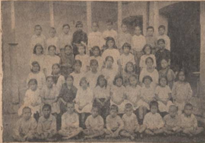
Grupo de niños que formaron las colonias escolares de vacaciones, organizadas en Costa Rica en enero de 1920, en que se inauguró esa institución.