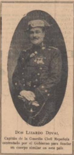
DON LEONARDO DOVAL, Capitán de la Guardia Civil Española contratado por el Gobierno para fundar un cuerpo similar en esta país