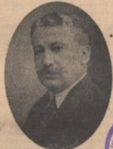
JULIO ACOSTA GARCÍA, Presidente de Costa Rica

La ocasión es oportuna para expresar a S. E. que el Gobierno y Pueblo de Costa Rica desean fervientemente que el Convenio suscrito a bordo del «Tacomas» dirima para siempre las diferencias que a él dieron origen y las que pudiesen surgir en el futuro